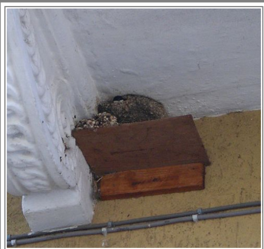
Nido di rondine con protezione sottostante anti guano