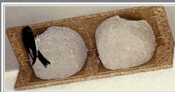
Nido Artificiale doppio per balestrucci